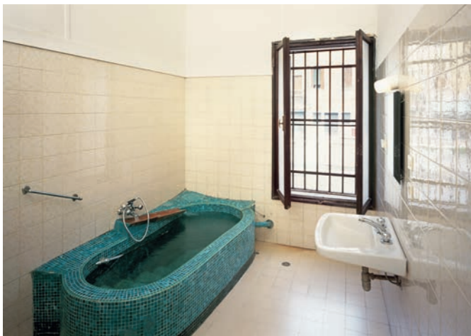
VENEDIG

Die Mikwe, wörtlich „Wasseransammlung“, ist ein jüdisches Tauchbad, welches der rituellen Reinigung von Körper und Geist dient. Die Bestimmungen zur Nutzung der Mikwe finden sich im Mischna-Traktat Mikwaot und gehen auf biblische Vorstellungen und Gebote zu Reinheit und Unreinheit zurück. Nur im Wasser einer Mikwe, die „lebendiges“, d.h. ungeschöpftes Grund-, Fluss- oder Regenwasser haben muss, können Personen oder Gegenstände vom Zustand des Unreinen wieder zum Zustand der Reinheit gelangen. Bei Menschen ist die rituelle Reinigung zu bestimmten Zeiten im Lebenszyklus oder bei Grenzerfahrungen nötig. Der Akt der Reinigung besteht im Untertauchen des ganzen Körpers. Zuvor muss der Körper gründlich gereinigt werden, da die Mikwe ausschließlich der Tahara, also der geistigen und spirituellen Reinheit, dient.