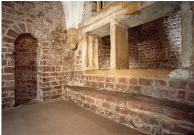
SPEYER